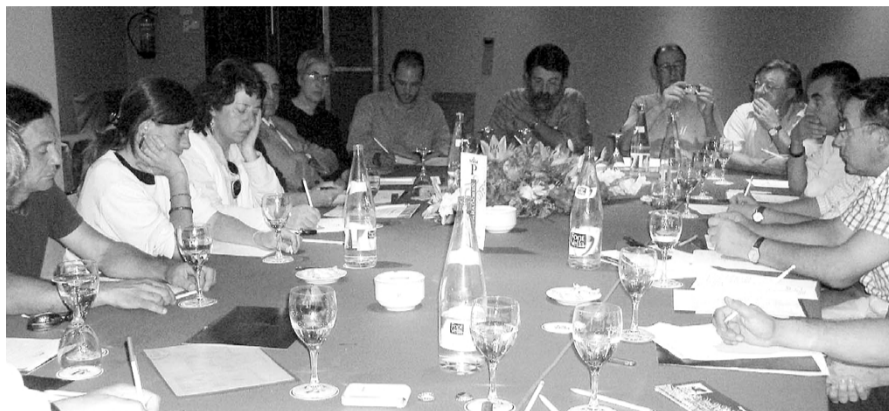
UN MOMENT DE LA REUNIÓ D'ENTITATS I COL·LECTIUS DEL PIRINEU CATALÀ, EL PASSAT 27 DE SETEMBRE.

La inclusió d'un tractament específic per a les terres de muntanya, reflectit en l'apartat 2 de l'article 130 de la Llei de Muntanya, aprovada pel Parlament de Catalunya l'any 1983, és una de les principals conquestes d'aquests abanderats de la defensa del Pirineu. Els grans coneixedors de la serralada expliquen que les comarques d'aquest territori muntanyenc tenen especificitat pròpia per múltiples qüestions: per raons d'orografia de muntanya i de la preservació de la natura; per raons d'agricultura d'alta muntanya i la seva vertiginosa reconversió; per la seva dedicació al sector serveis en general; per la seva excessiva dependència del sector de la construcció; per no tenir un sector industrial arrelat (la diferència del Berguedà, el Ripollès o la Garrotxa); per la cultura d'alta muntanya; o per ser pedra de toc