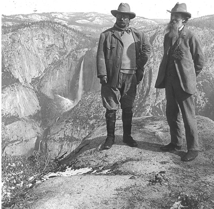
THEODORE ROOSEVELT I JOHN MUIR A GLACIER POINT, A LA VALL DE YOSEMITE (CALIFÒRNIA), CIRCA 1906.

En aquest sentit, la recuperació dels clàssics del pensament ecologista i de la crítica a l'industrialisme és una tasca intel·lectual tan necessària com sovint mal compresa. Refer les lectures clàssiques sobre la muntanya i el bosc des d'un punt de vista ecològic –penso ara en la poesia de Verdguer o de Maragall, o la recent aportació de Miquel Desclot– hauria de ser una feina assumible des de les aules de l'escola primària, senzillament com una forma d'educar la sensibilitat de la mainada i l'amor a la terra –en el més estricte sentit del mot. Tenim a Catalunya una poesia que exalta el medi ambient, la muntanya, el bosc i la mar, senzilla com pa tou i que, com el pa tou mateix, cada dia és més difícil de trobar enlloc. I trobem encara molt viva una tradició de muntanyisme autòctona que compta entre les més riques del món. No debades, i encara que ho sàpiga molt poca gent, la selecció catalana de curses de muntanya era campiona del món absoluta molt abans que