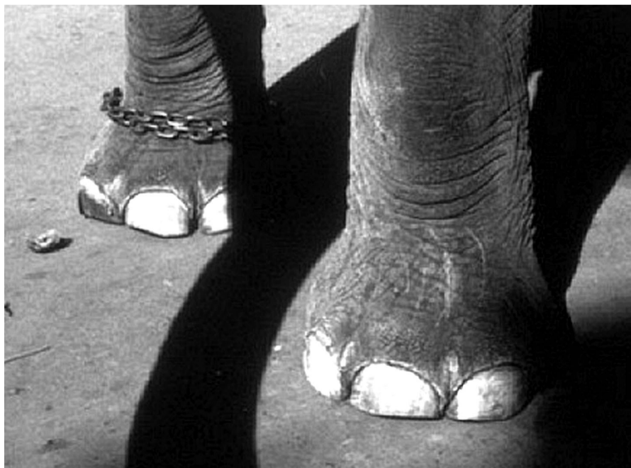
ELS ELEFANTS SEGRESTATS ALS ZOOS PATEIXEN GREUS PATOLOGIES, TANT FÍSQUES COM PSICOLÒGIQUES.

Més enllà, però, del patiment dels animals en captivitat es planteja la qüestió ètica i moral de respectar el paper que les espècies juguen en l'equilibri dels ecosistemes. El debat no està doncs en la classificació de quins animals són silvestres i quins no, de quins es poden exhibir i quins no, sinó en el fet que la societat del segle XXI hauria de madurar i deixar de veure els animals com un espectacle d'oci. Per iniciar aquest camí, Attentio-DEPANA reclama l'ampliació de l'actual Ordenança a totes les espècies silvestres, començant pels mamífers marins.