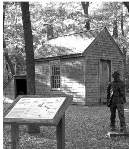
REPRODUCCIÓ DE LA CABANA DE THOREAU AL LLAC DE WALDEN A CONCORD (MASSACHUSETTS).