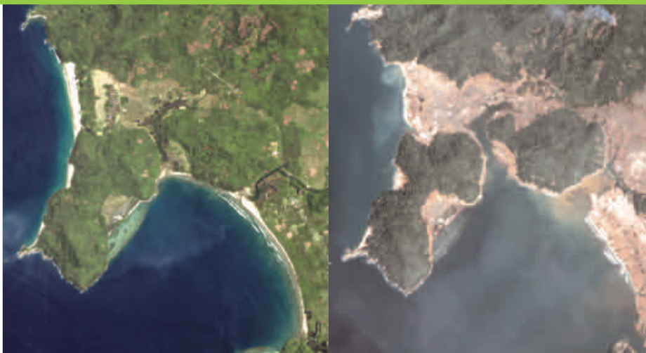
L'ABANS I EL DESPRÉS DEL TSUNAMI A LA COSTA SRILANKESA: LA DESTRUCCIÓ DELS MANGLARS PER A LA PRODUCCIÓ INDUSTRIAL DE GAMBES HA ESTAT UNA DE LES CLAUS ECOLÒGIQUES DEL DESASTRE.

Els aliments, l'aigua i els medicaments són les més urgents necessitats dels supervivents dels tsunamis. Però, al mateix temps que els sistemes públics s'han de mobilitzar per cobrir aquestes necessitats essencials, la globalització de les grans multinacionals porta cap endavant i a tota vela la seva corporativització i privatització. Mentre és sabut que l'Índia i altres països necessiten fàrmacs genèrics de baix cost que tractin amb urgència la salut pública que el tsunami ha deixat enrere, el govern aprovava un decret que evitarà la producció de medicaments de baix cost des de l'1 de gener d'enguany. La incongruència entre el món de la globalització corporativa, de l'OMC (Organització Mundial del Comerç) imposant els TRIPS (aspectes comercials sobre els drets de propietat intel·lectual), i el planeta de la gent ha estat produïda irònicament pel tsunami. El decret sobre patents de l'Índia s'aprovava el mateix dia que el desastre colpia les