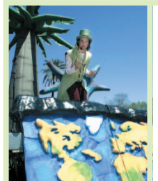
Fotografia de la IX Fira per la Terra