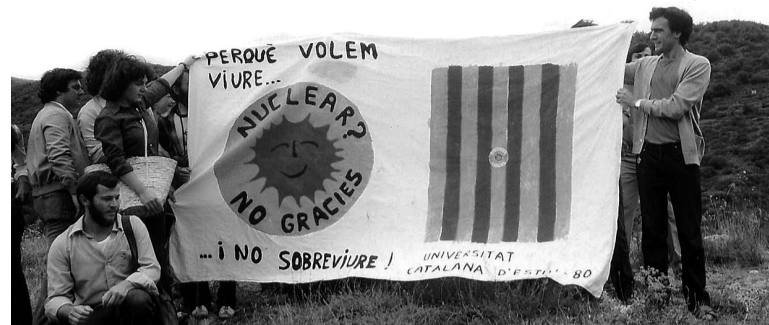
MANIFESTACIÓ «ECONACIONALISTA» AL CASTELL DE RIÀ (PRADA DE CONFLENT, 1980).

En El fet de la nacionalitat catalana , Prat de la Riba hi deia: «Siguem americans. Eduquem-nos a Amèrica i a l'americana. Res d'europèitzar-se» (tot referint-se a les formes de vida i consum dels catalans). I en un altre indret hi afegia: «La preparació per a la guerra és la garantia més solida de la pau. La guerra que