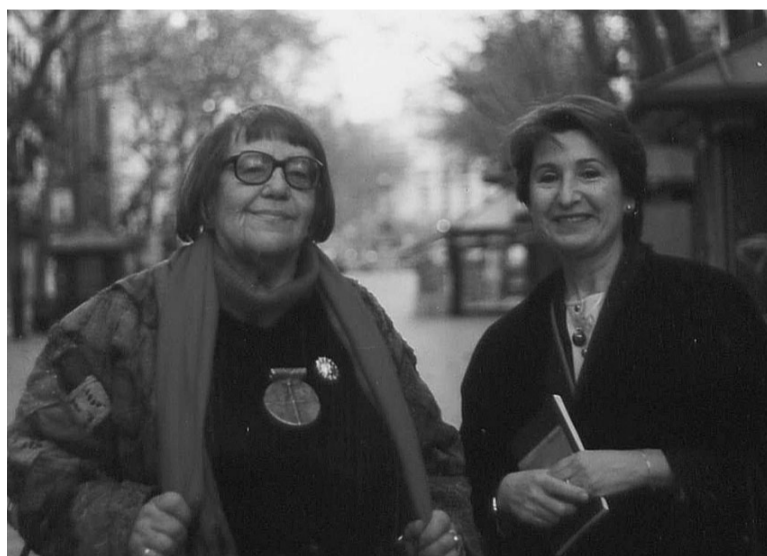
FRANÇOISE D'EAUBONNE, FUNDADORA A PARÍS DEL MOUVEMENT DE LIBÉRATION DES FEMMES (MLF), AMB PILAR SENTÍS A LA RAMBLA DE BARCELONA EL 14 DE DESEMBRE DE 1996.