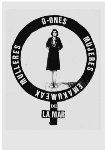
PORTADA DE LA REVISTA DEL GRUP LA MAR.